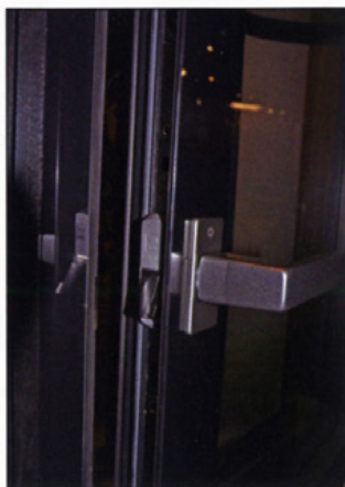
Détail de l'ouvrant en verre.